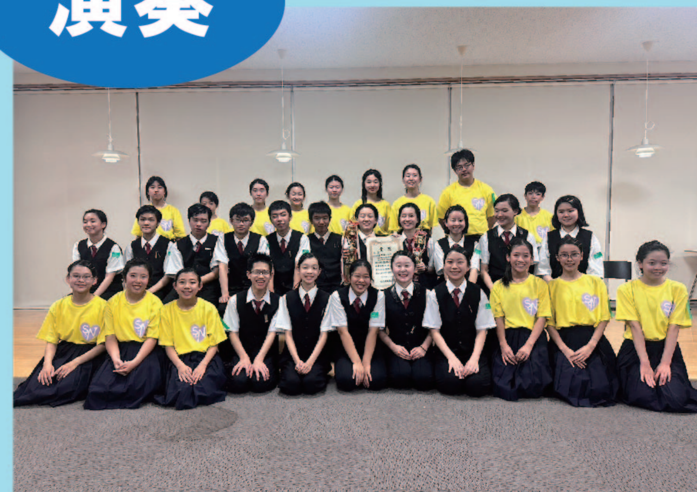
新湊南部中学校・新湊中学校合同バンド ※雨天中止