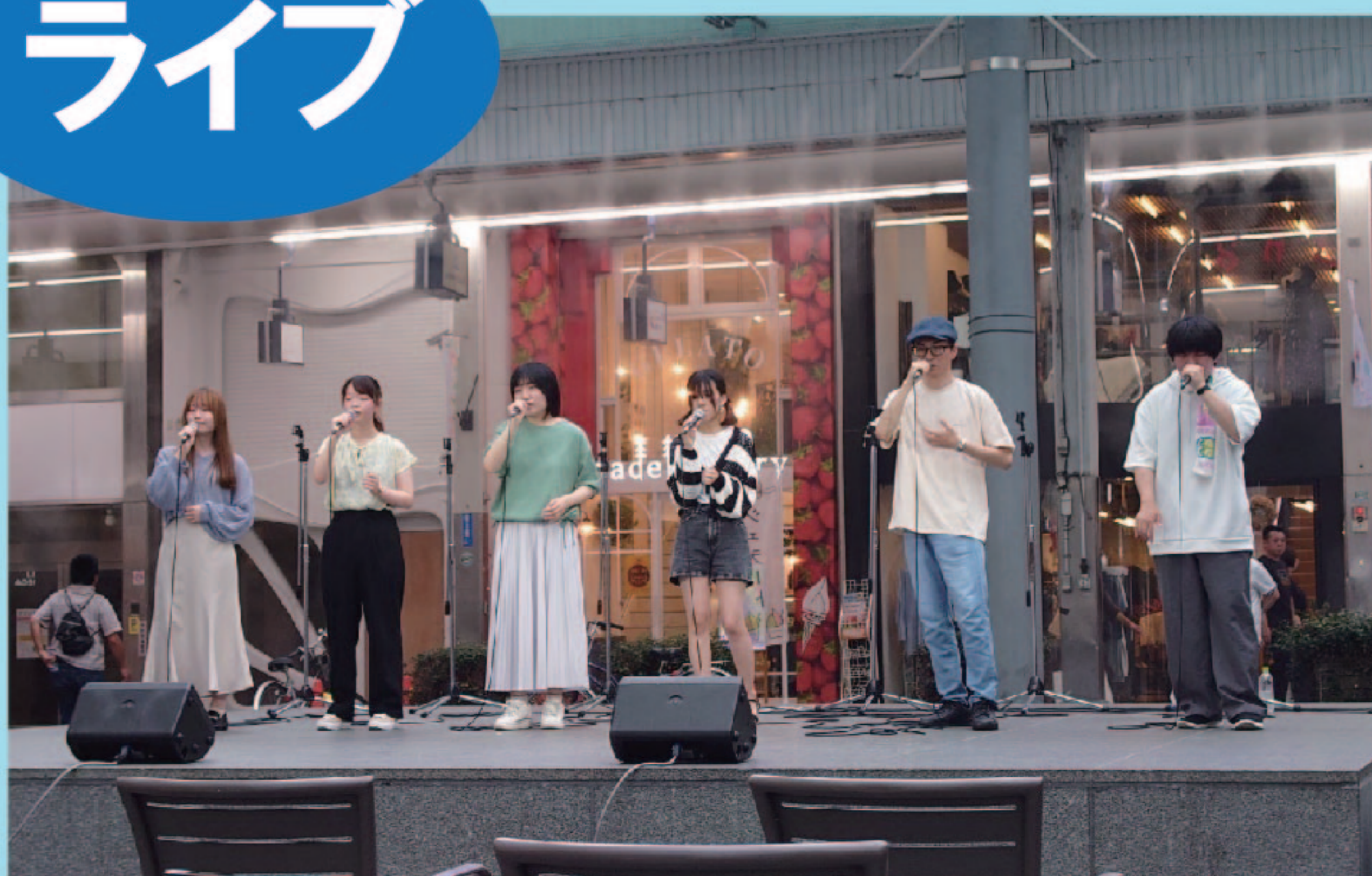
富山県立大学アカペラサークル 「Growing」