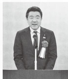
参議院議員 野上 浩太郎 様