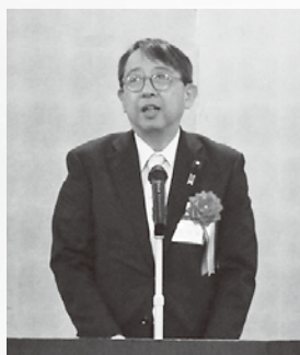
衆議院議員 橘 慶一郎 様