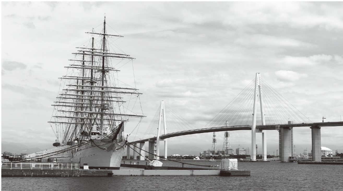
祝 新湊大橋開通10周年・海王丸パーク開園30周年