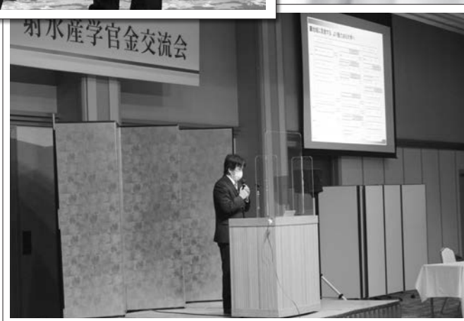
2/1 射水産学官金交流会講演会