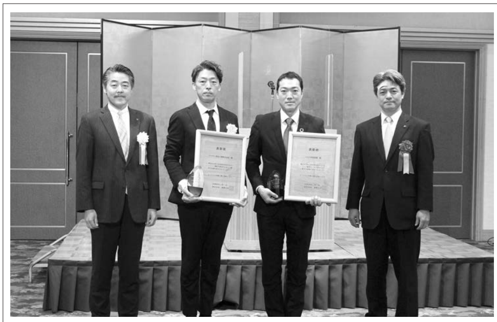
2/1 第11回射水市きらりカンパニー 顕彰表彰式