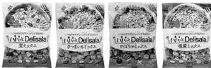
▲パパッと Delisala シリーズ

また、コロナ禍の巣ごもり消費に対応すべく昨年11月にマーケティング部を設置しました。会員制交流サイト（SNS）や動画投稿サイトを活用し、自社製品のレシピ情報を提案するとともに、自社のECサイトへの誘導も図っています。またお客さまの声を聴き、真摯に向き合い、それを商品やサービスに反映することを使命として取り組んでおります。