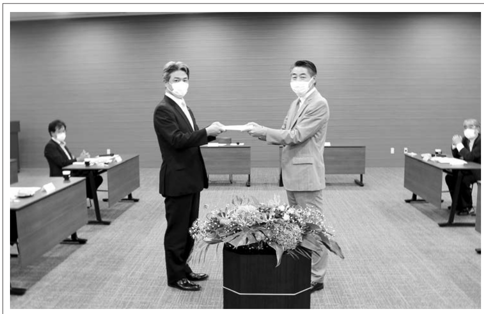
9/27 市への提言要望の提出