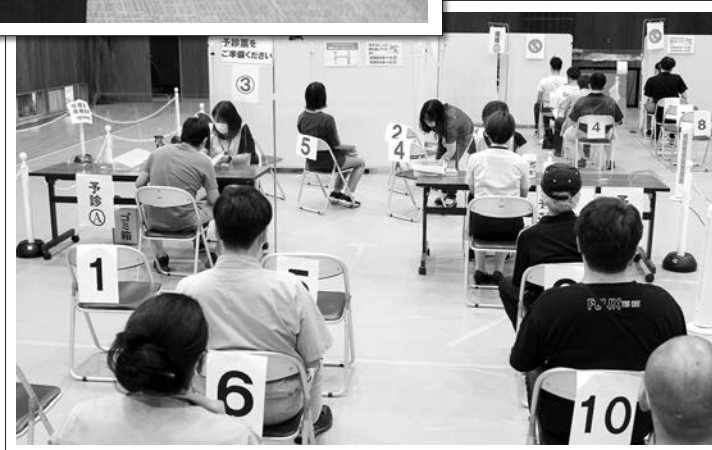
9/8・10・15・17・24 職域接種