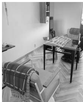
▲射水市創業支援事業補助金により購入したセット台

開業にあたり、経営面、資金面では漠然とした不安があり、商工会議所を訪問し相談した所、経営指導員の方より、射水商工会議所主催のいみず創業塾を受講するように提案頂きました。創業塾では、創業計画、事業の展開方法、マーケティング等、様々なことを学ぶことができ、資金調達には、射水市創業支援事業補助金を活用させていただくことができました。補助金で店内のセット台や、店舗に必要な備品を揃えることができ、開業にあたりとても助かりました。