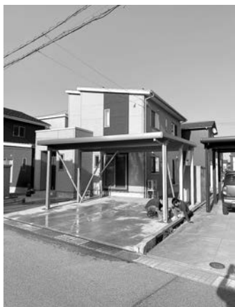
カーポート新設工事

これから相談会やセミナー及び講習会の受講などに参加して、自身の経営に関する様々な知識を高めていきたいと思っております。