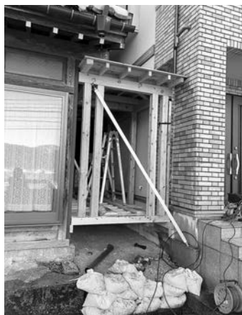
新旧住宅を繋ぐための 渡り廊下増築工事