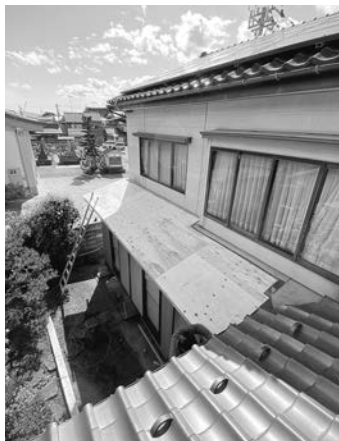
雪害による屋根軒先折れ修復工事