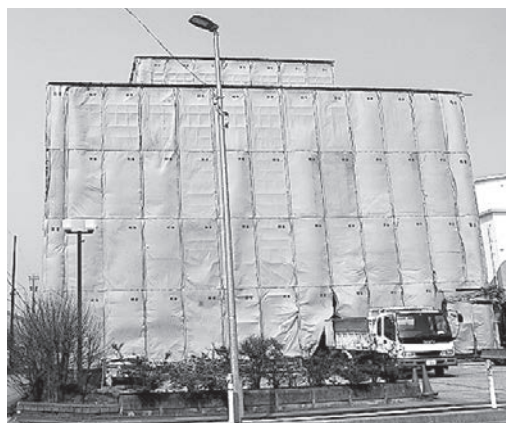
旧本所会館 アスベスト除去工事中