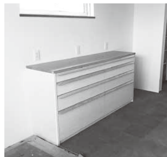
キッチンキャビネット