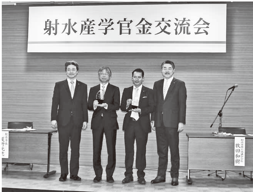
2/3 第10回射水市きらりカンパニー顕彰表彰式