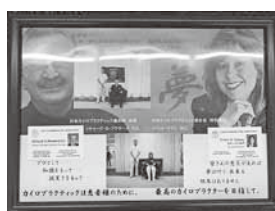
▶▶有名なアメリカのカイロプラクティックドクターから研修を受けたときの写真と修了証書

ことにあります。身体の歪みをカイロプラクティックの技術で整えてから、HBCB (ビューティーコントロールバンド) 等を使用し姿勢の維持に必要な筋力アップ・脂肪の燃焼を行います。さらにアメリカ・世界でも推奨されている方法を基に構成された「技術+総合指導法」を行うことにより、日常生活への改善を行い、より健康へと導けるようご指導いたします。