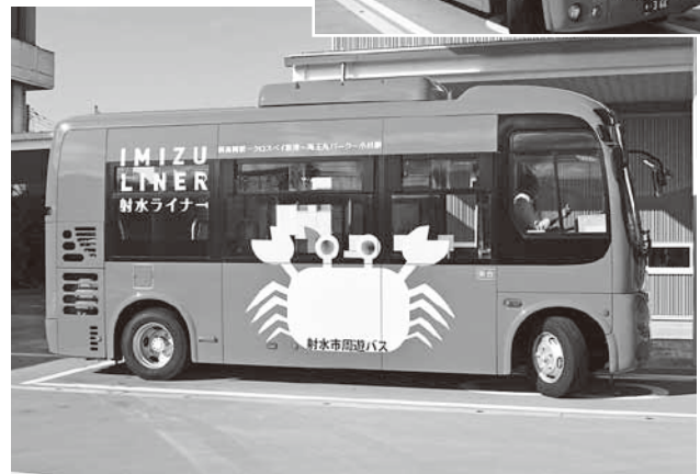
9月19日 「射水市周遊バス」実証運行開始