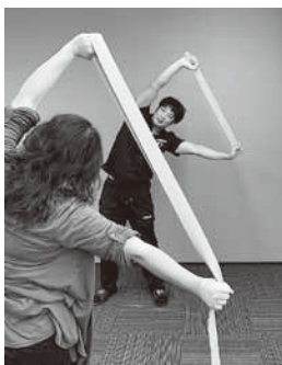
▲HBCB (ビューティーコントロールバンド) によるパーソナルトレーニングの様子

スポーツ系の学校を卒業し、スポーツインストラクターを目指していた頃、アメリカでカイロプラクティックとトレーニングが融合した「スポーツカイロ」が盛んであるということを知り、「スポーツカイロ」への関心が高まりました。