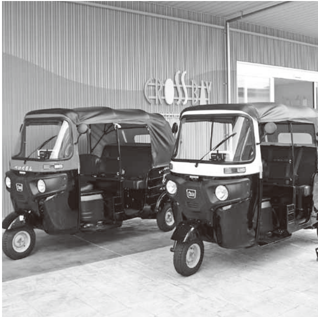
9月14日 「べいぐるん」実証運行出発式