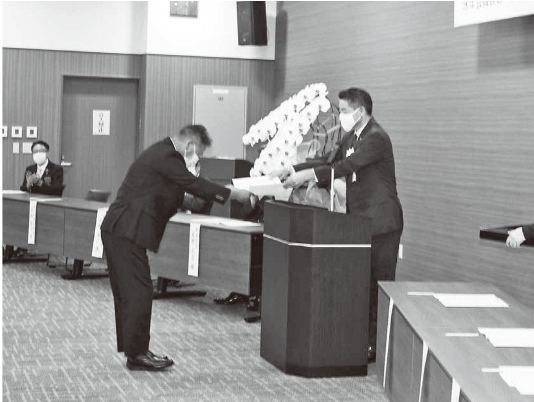
8月11日 会員事業所等表彰式