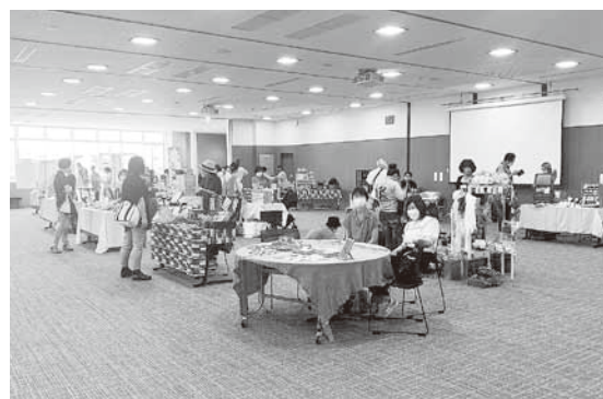
オープニングイベントの様子 (カモメとネコの手作りマルシェ)