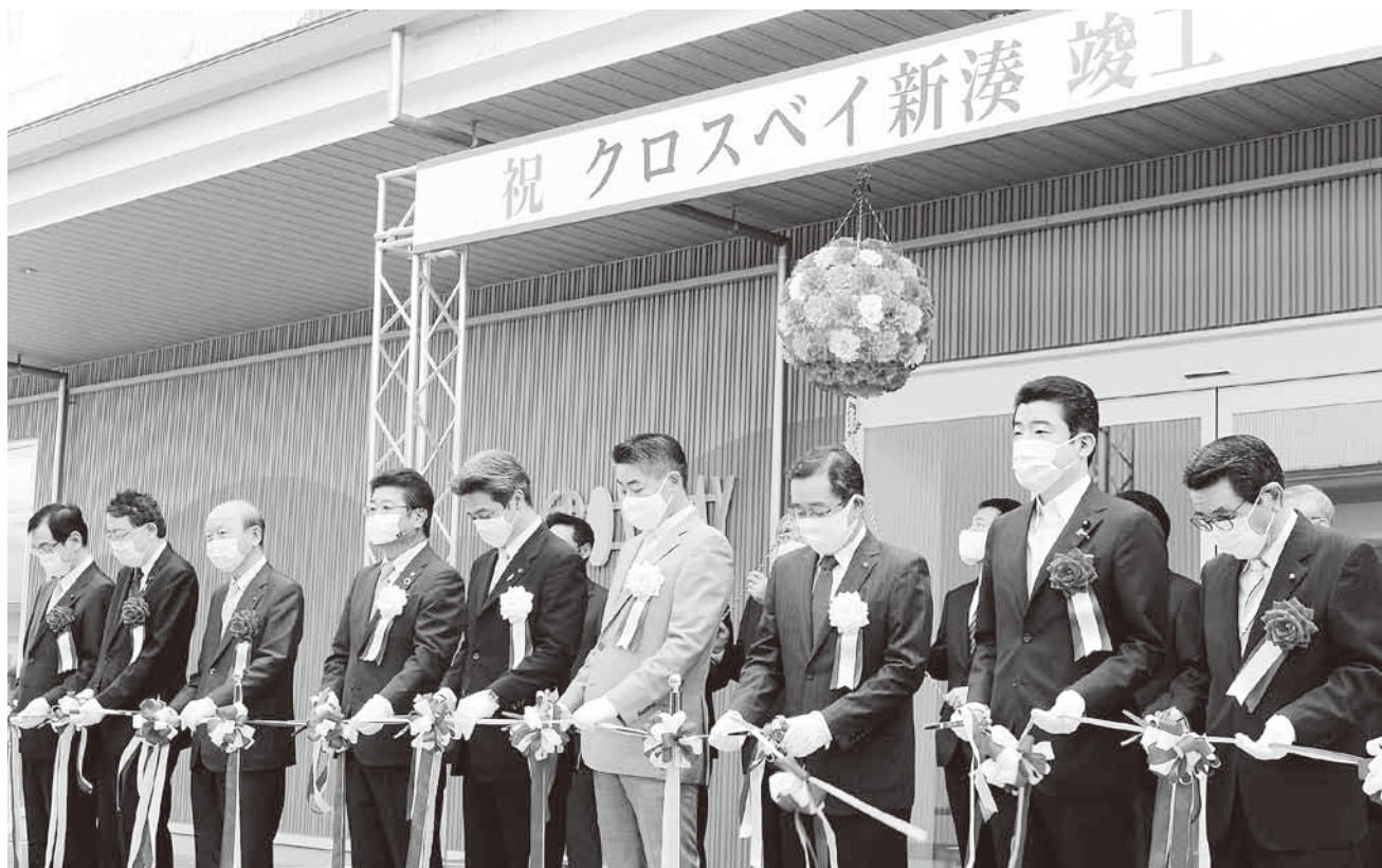
8月1日 クロスベイ新湊 竣工式