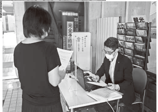
国の持続化給付金申請サポート会場開設に併せ「新型コロナウイルスに関する緊急経営相談窓口」を開設