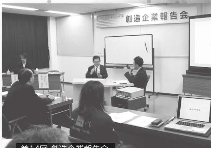
第14回 創造企業報告会