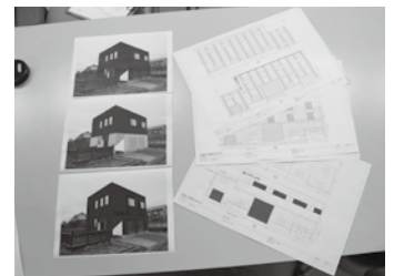
▲独自のCG図(左)と設計図(右)

これからも創意工夫を重ね、お客様から感謝され、必要とされる事業所を目指していきたいと思っております。