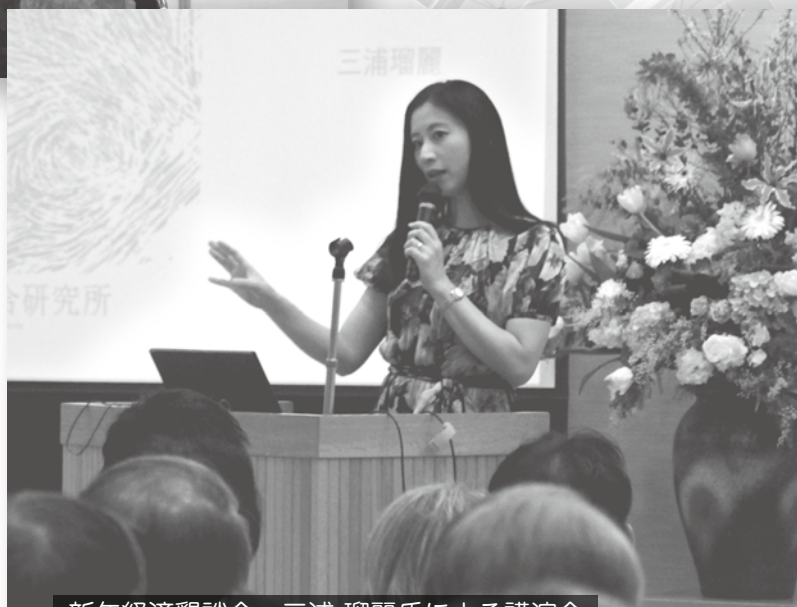
新年経済懇談会 三浦 瑠麗氏による講演会