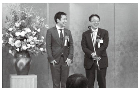
▲(左)永森県議会議員 (右)八嶋県議会議員