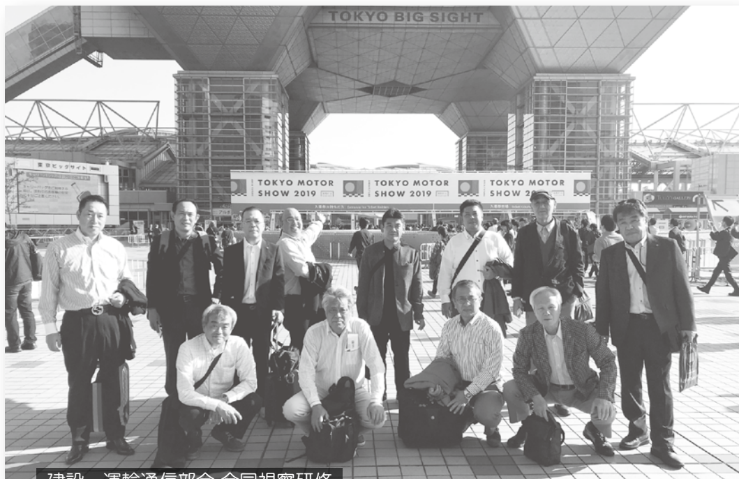
建設・運輸通信部会 合同視察研修