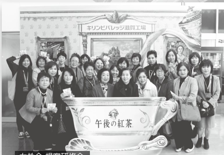
女性会 視察研修会