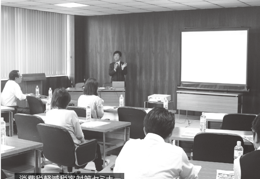
消費税軽減税率対策セミナー