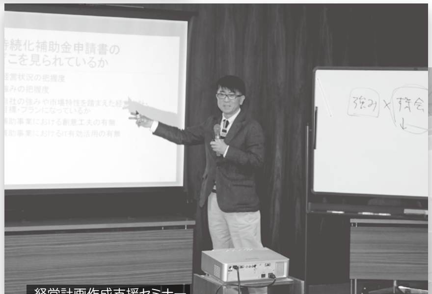
経営計画作成支援セミナー