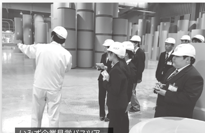
いみず企業見学バスツアー