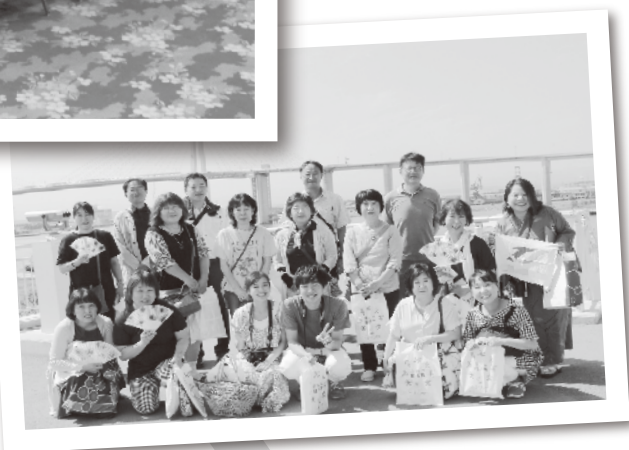
内川再発見ツアー▶