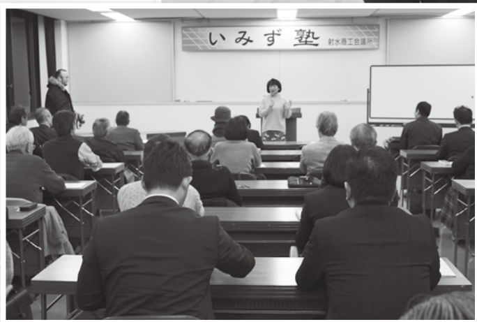
▲いみず塾（2月1日 第10回目開催）