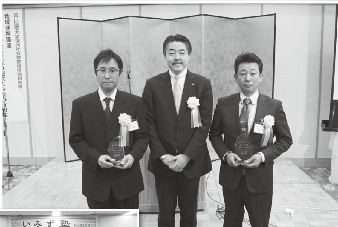
▲きらりカンパニー顕彰表彰式