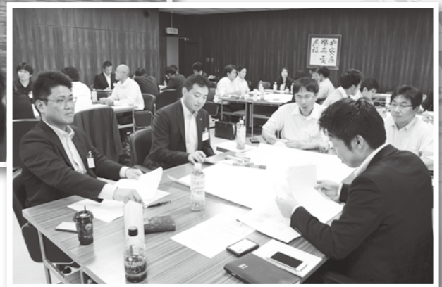
▲射水市産業振興研究会 ワーキンググループ