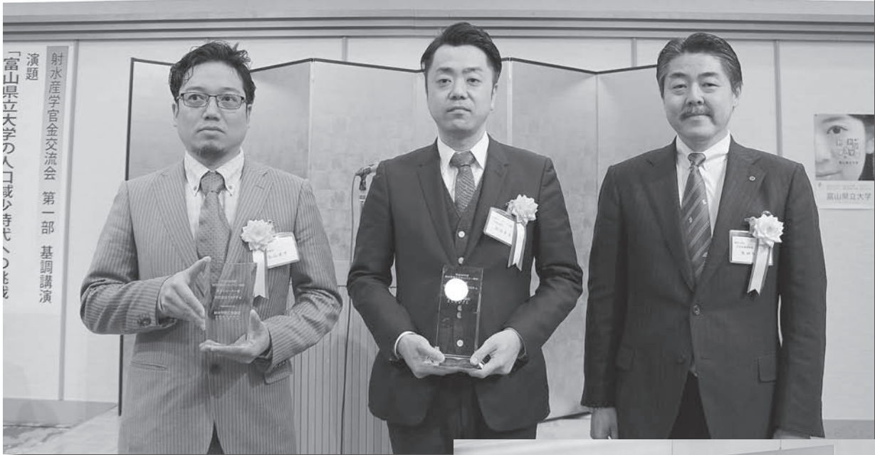
▲きらりカンパニー顕彰表彰式