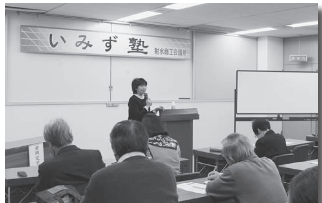
▲いみず塾(2月2日開催)