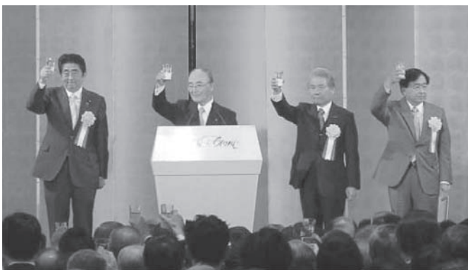
▲乾杯する三村会頭(左から2人目)と安倍首相(左)

日本・東京商工会議所、日本経済団体連合会、経済同友会の経済3団体は1月5日、新年祝賀パーティーを開催した。パーティーには、全国の経営者ら約1900人が出席。安倍晋三首相も駆けつけた。