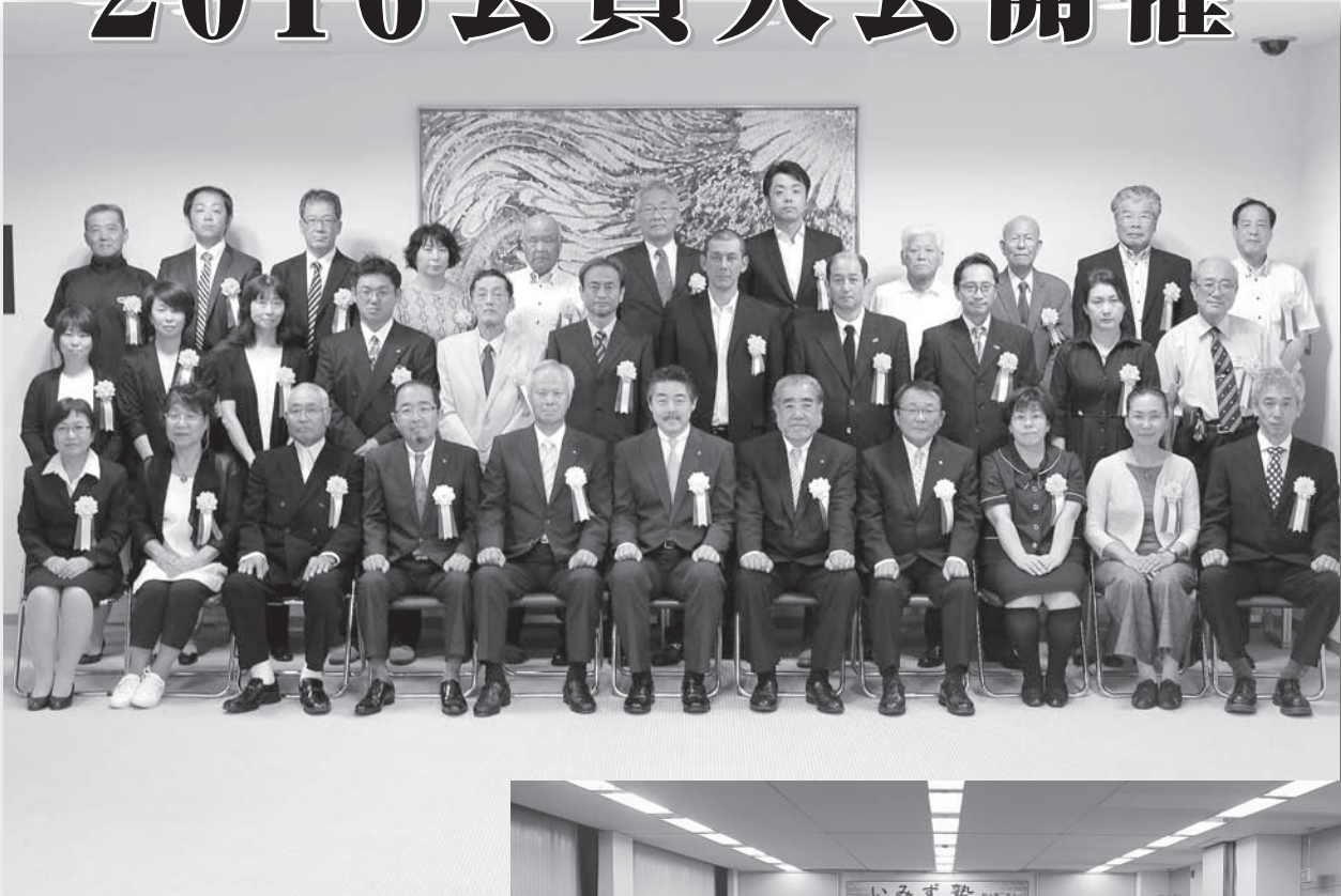
▲会員大会表彰者の皆様 おめでとうございます