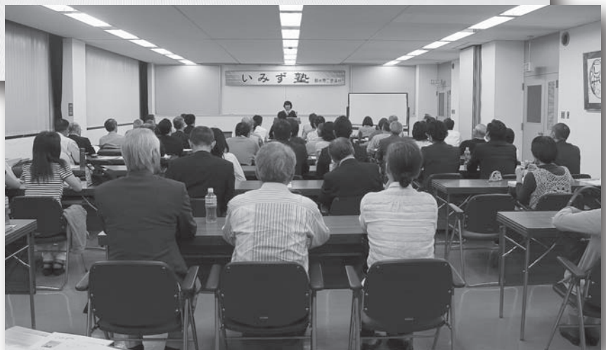
▲第4回いみず塾開講