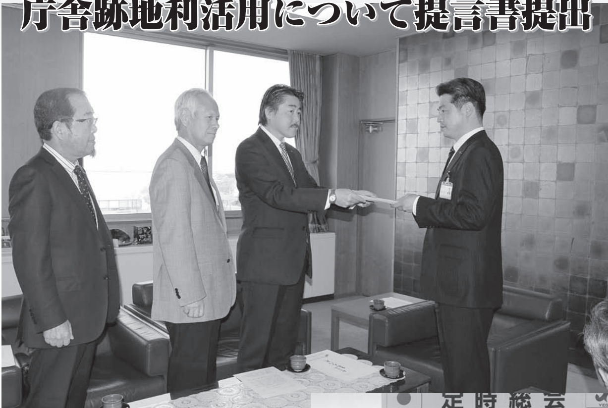
▲4月15日 射水市小杉庁舎にて