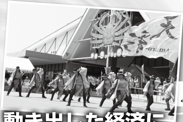
新湊きつときと よさこい大会 (4月27日)