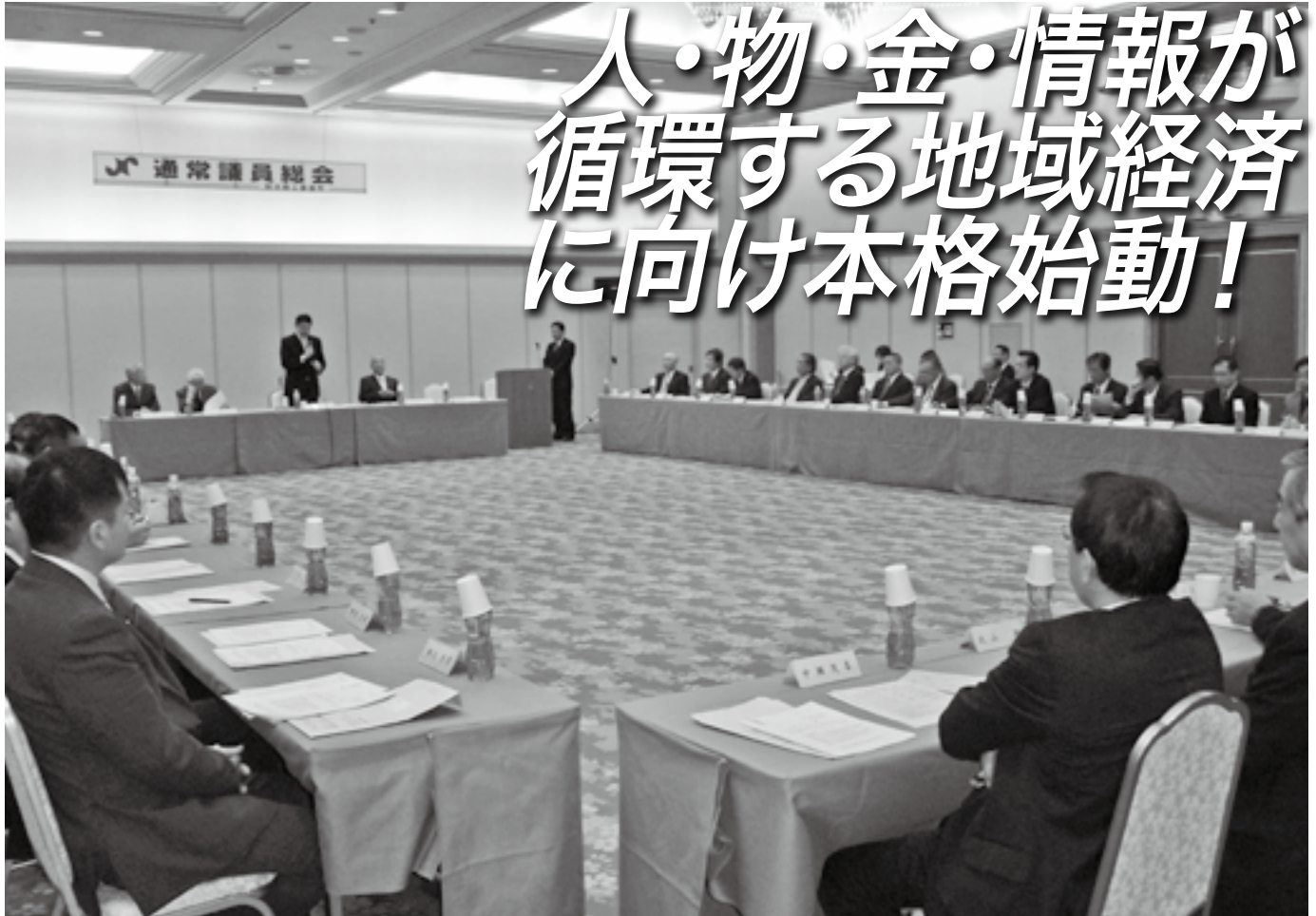
▲平成24年通常議員総会 (3月27日)